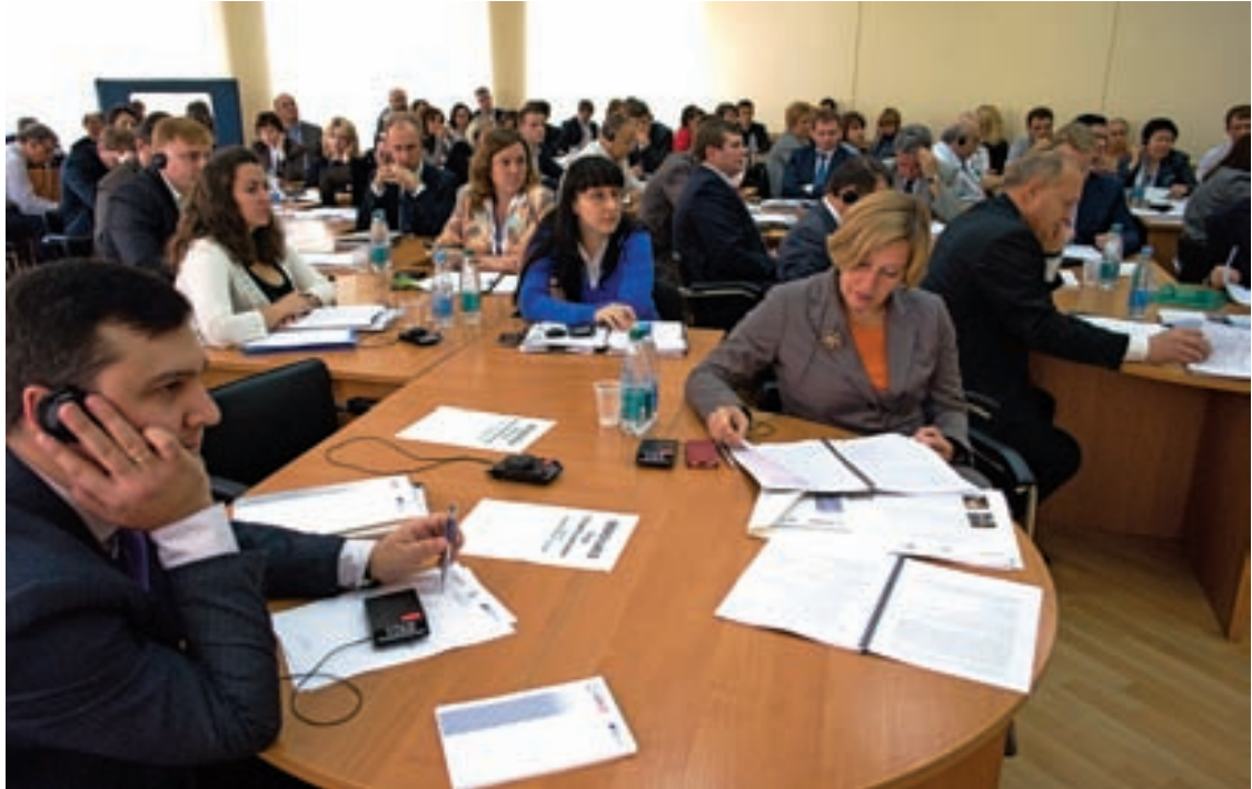
Серед близько сотні учасників заходу були представники 13 центральних органів виконавчої влади, народні депутати, судді, юристи-практики, фахівці з неурядових організацій, а також експерти зі Словаччини та Польщі.

(її статтю читайте у цьому ж номері Вісника), складнощів з імплементацією АРВ зазнають практично всі країни, де він проводиться. Тож проблеми із його застосуванням в Україні не є чимось незвичайним на тлі світової практики.