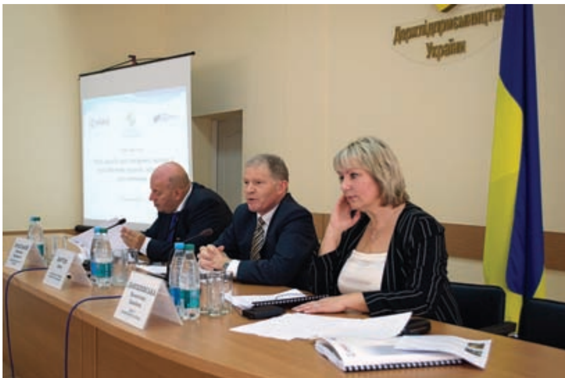
Із вітальним словом до учасників круглого столу звернулися Михайло Бродський, голова Державної служби України з питань регуляторної політики та розвитку підприємництва, директор місії USAID в Україні Джед Бартон і Валентина Данішевська, директор Центру комерційного права

фактично звело нанівець відповідальність ініціаторів регулювання за його наслідки. Ці проблеми призвели до формальної, поверхневої підготовки АРВ на всіх рівнях державного управління.